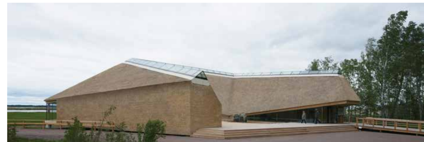
Nederst er det naturcentret Tåkern ved søen af samme navn, et eksempel på moderne brug af stråtag, tegnet af Wingårdh Arkitektkontor AB.