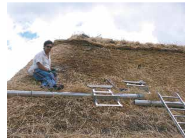
Øverst ses en færdig hytte fra Gotland med stargræs-tag – samme slags som blev tækket til det internationale møde.