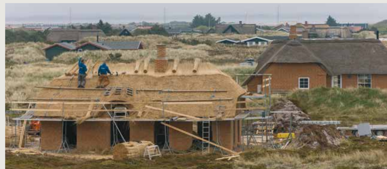
Et af projekterne er her ved Søndervig på den jyske vestkyst, hvor forslaget lyder på 500 feriehuse og Nordeuropas største badeland med en samlet investering på omkring en milliard kroner. Billedet er fra tækning i et sommerhusområde ved Søndervig.