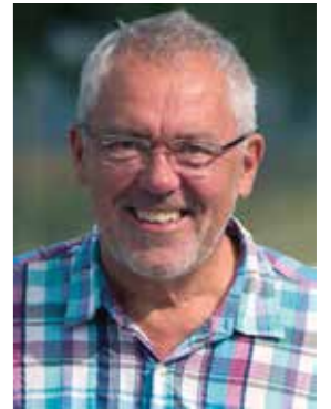
AF JØRGEN KAARUP TÆKs REDAKTØR

På alle disse fronter står tækkebranchen stærkt, fordi vi arbejder med et naturprodukt, der bidrager positivt til CO2-balancen, fordi planterne i stråtaget bruger CO2 under væksten og afgiver ilt. Straatagets Kontor har i samarbejde med Teknologisk Institut gennemført en miljøvurdering, som var meget positiv for stråtaget. Nu tager vi næste skridt og gennemfører en total livscyklusanalyse, hvori affaldshåndteringen også gennemgås.