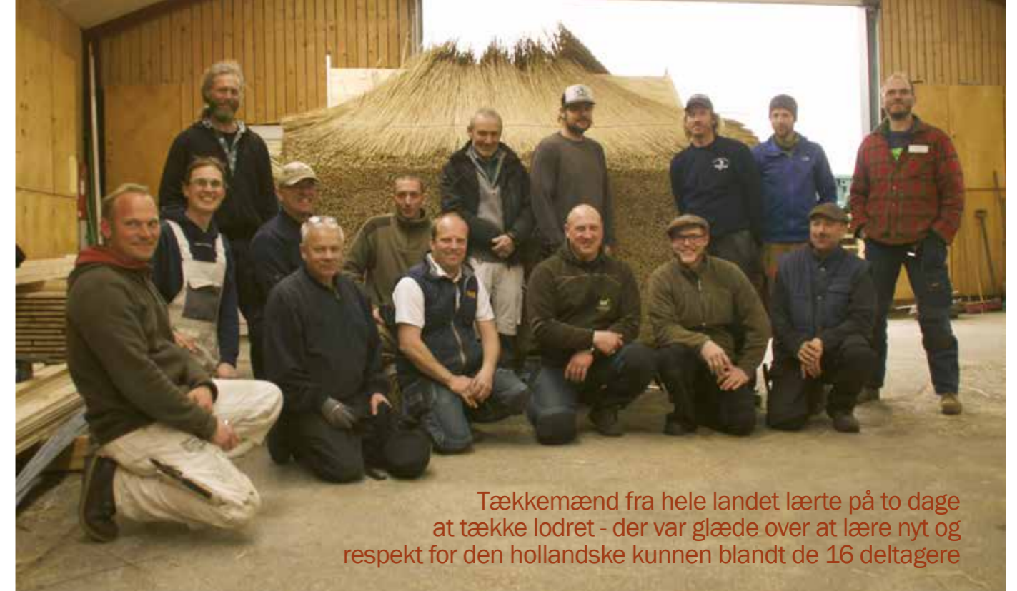
Tækkemænd fra hele landet lærte på to dage at tække lodret - der var glæde over at lære nyt og respekt for den hollandske kunnen blandt de 16 deltagere

Vi var vist nogenlunde lige begejstrede for de to dage med nye udfordringer, masser af grin og godt samvær med kolleger fra hele landet. Jeg valgte at lave interview med to fra hver sin ende af landet, så deres